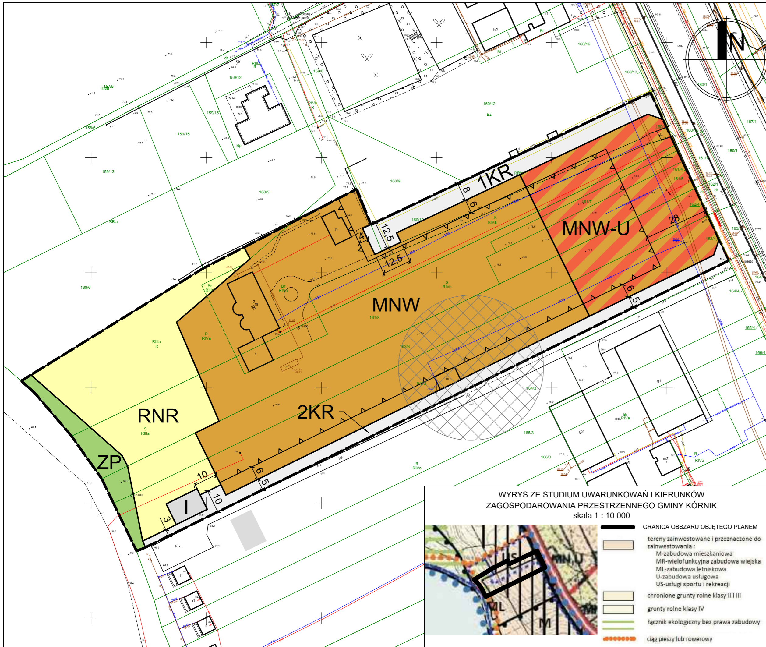
WYRYS ZE STUDYUM UWARUNKOWAŃ I KIERUNKÓW ZAGOSPODAROWANIA PRZESTRZENNEGO GMINY KÓRNIK skala 1 : 10 000

Układ współrzędnych: Państwowy Układ Współrzędnych Geodezyjnych PL 2000 Opracowanie na podstawie mapy zasadniczej w postaci wektorowej Licencja nr GKG.GZE.4007.101.2022_3021_P wydana przez Starostę Poznańskiego