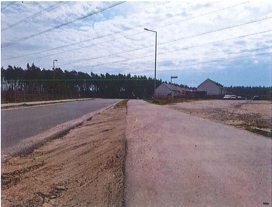
Zdjęcia obrazujące degradację ścieżki pieszko-rowerowej oraz krawędzi jezdni ulicy Spacerowej.