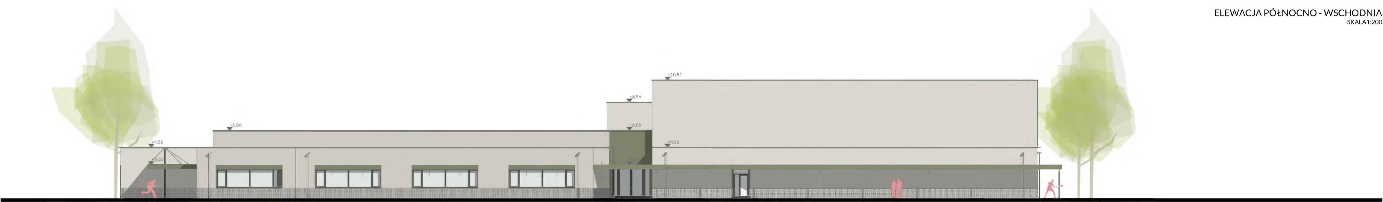
ELEWACJA PÓŁNOCNO - WSCHODNIA SKALA 1:200