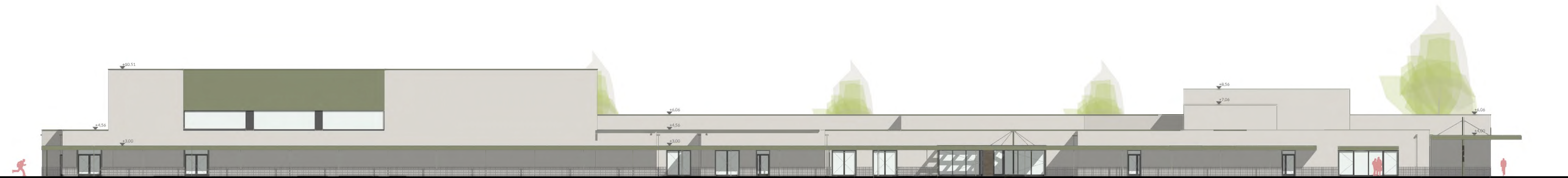
ELEWACJA PÓŁNOCNO-ZACHODNIA SKALA 1:200