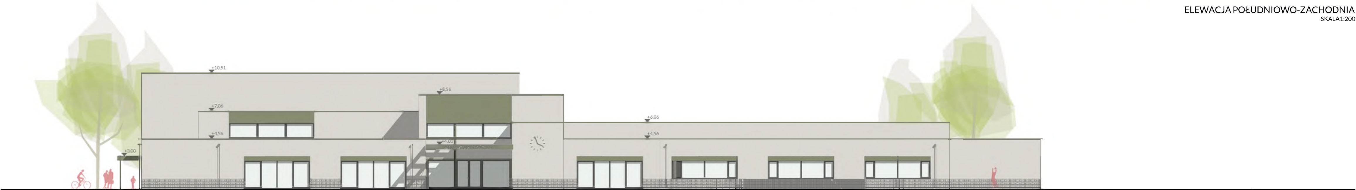
ELEWACJA POŁUDNIOWO-ZACHODNIA SKALA 1:200

Projekt uwzględni racjonalne gospodarowanie wodą, z naciskiem na retencję i ponowne wykorzystanie zasobów. Przewidziano ogród deszczowy do gromadzenia wód opadowych oraz system wykorzystania deszczówki do podlewania roślin na terenie szkoły.