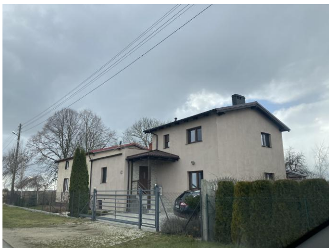
Budynki mieszkalne jednorodzinne