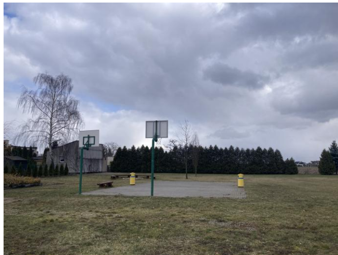
Boisko przy świetlicy wiejskiej