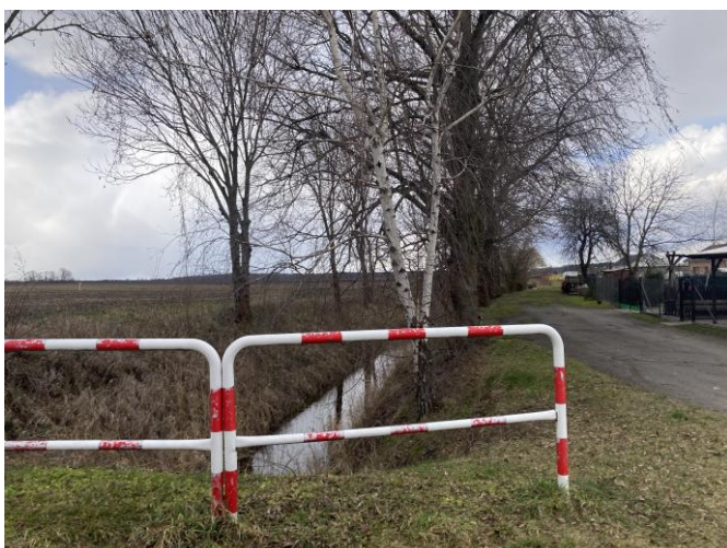
Rów melioracyjny przy południowej granicy obszaru planu