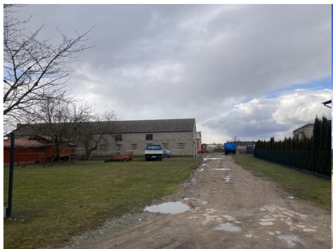
Zabudowa zagrodowa w obrębie planu