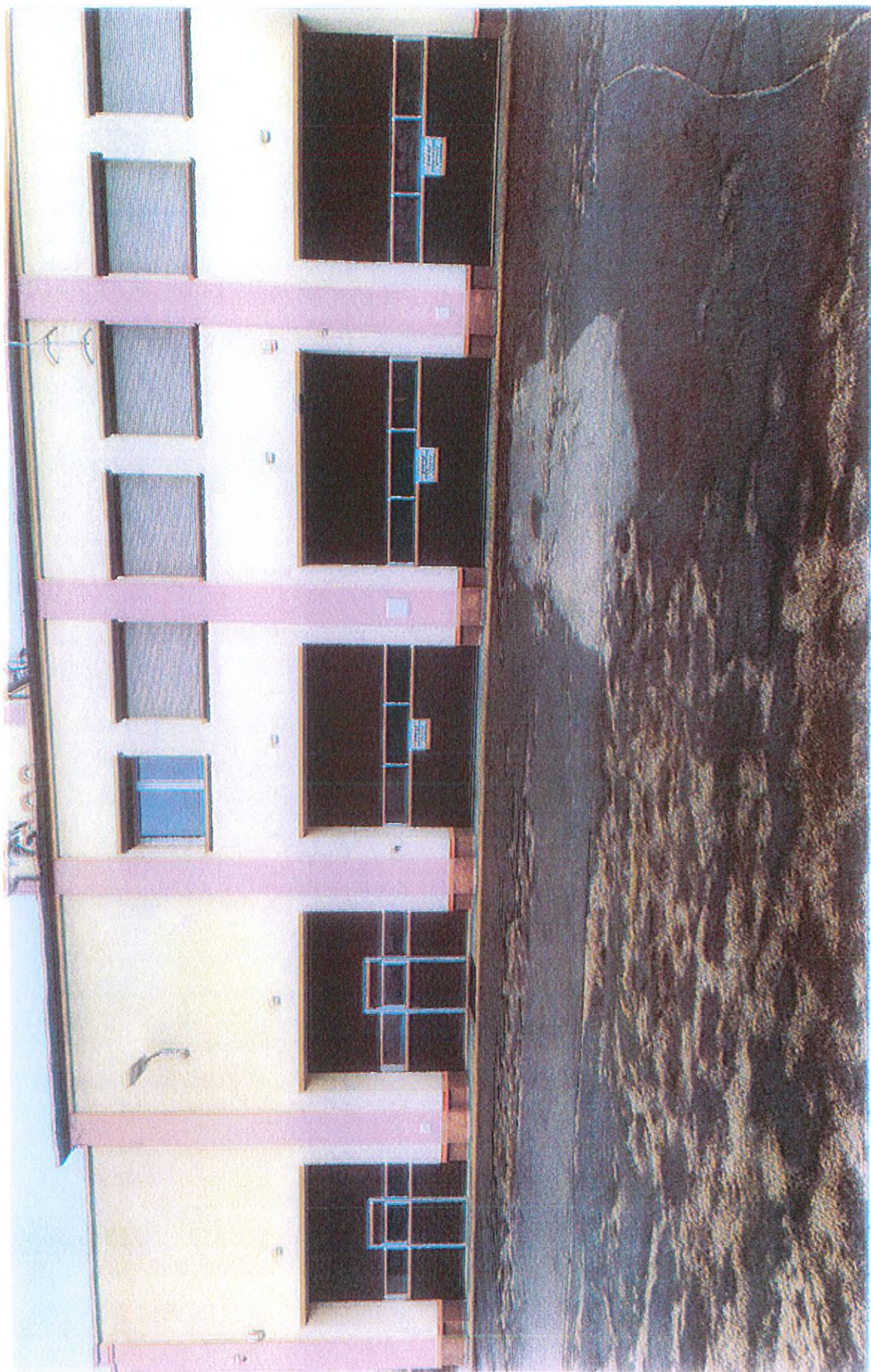
Załącznik nr 3 do ogłoszenia o przetargu na sprzedaż zbędnych składników rzeczowych majątku ruchomego Miasta i Gminy Kórnik